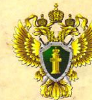
ПРОКУРАТУРА ГОРОДА САМАРЫ