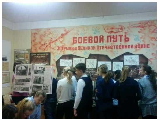
МБОУ Школа № 76