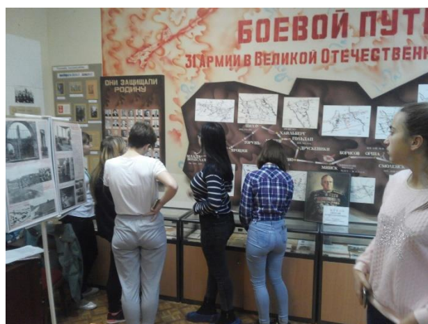
Самарский торгово-экономический колледж