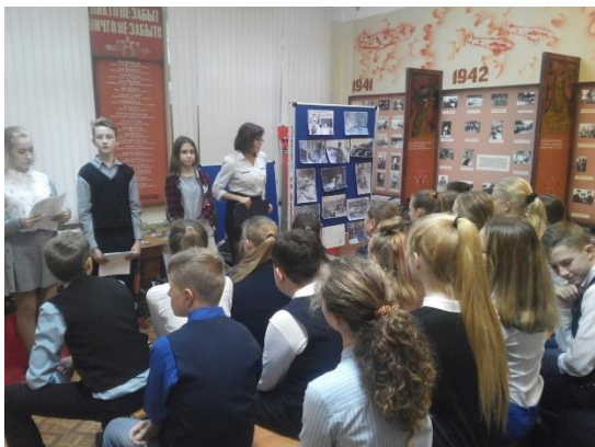
МБОУ Школа №94

Наш музей посетили учащиеся многих школ г. Самара и студенты торгово-экономического колледжа.